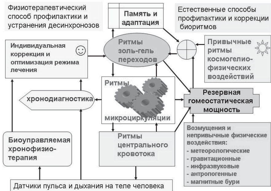
Рис. 2. Схема хронодиагностики, профилактики неблагоприятных реакций организма человека на непривычные внешние воздействия и устранения десинхронозов

Обычные способы физиотерапии не учитывают фазы биоритмов чувствительности и смещений